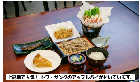
※The Park Lodge 上高地の昼食 (イメージ写真)

■ 乗鞍スカイライン 乗鞍スカイラインは、標高1,684mの平湯峠から乗鞍山頂（豊平）まで全長14.4kmの山岳観光道路で、昭和48年（1973年）から30年間は有料道路でしたが、平成14年10月31日の無料開放となり翌平成15年（2003年）に道路の渋滞解消と自然環境を保護するため、マイカーを規制しバスやタクシー・自転車だけが通行できる道路となりました。 ■ 乗鞍エコーライン 乗鞍エコーラインは、長野県松本市安曇（乗鞍高原）から乗鞍山頂の豊平までの道路。落葉樹林が多いため、9月下旬より10月上旬は紅葉の名所です。乗鞍スカイライン同様 2003年 三本滝ゲートより先は、マイカー規制のため、バスやタクシー・自転車以外は通行できません。