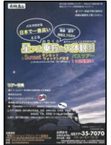
ドリームスター号

《開催期間》8月23日, 24日, 30日, 31日 9月6日, 7日, 20日, 21日 《主催》乗鞍エンジョイプロジェクト協議会 《参加費》大人5,000円(税込)・小人4,500円(税込) 《行程》高山駅～(ほおのき平バスターミナル)～乗鞍畳平～高山駅 《申込先》株式会社丹生川観光 TEL:0577-35-7070