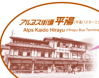
アルプス街道 平湯 (平湯バスターミナル) Alps Kaido Hirayu (Hirayu Bus Terminal)

平湯温泉・あかんだな駐車場方面は5番のりばです Buses bound for Hirayu Onsen leave from stop #5 at the Kamikochi Bus Terminal.