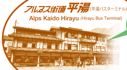
アルプス街道平湯 (平湯バスターミナル) Alps Kaido Hirayu (Hirayu Bus Terminal)