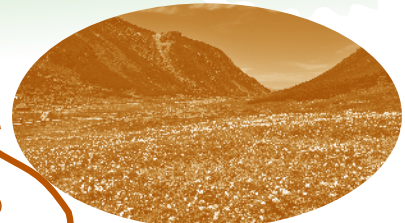
お花畑 Alpine Plants