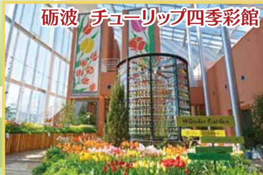
砺波 チューリップ四季彩館