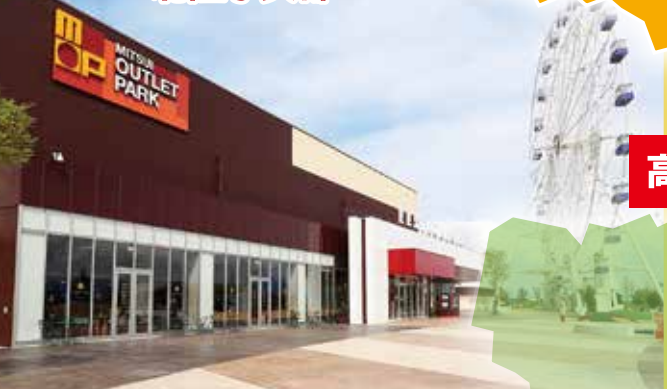
三井アウトレットパーク 北陸小矢部