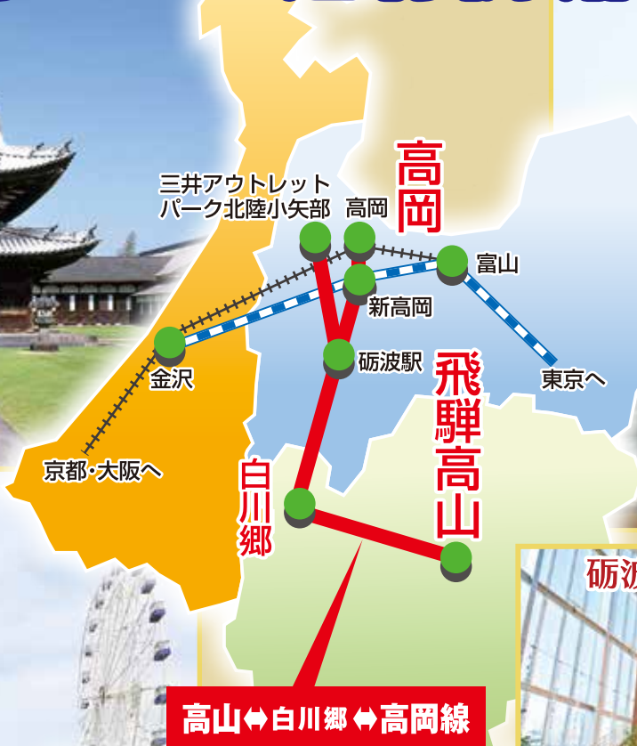
三井アウトレット パーク北陸小矢部