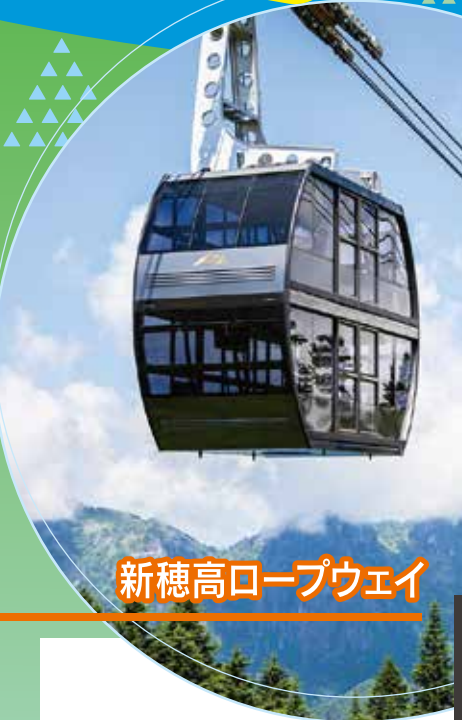
新穂高ロープウェイ