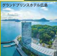
グランドプリンスホテル広島