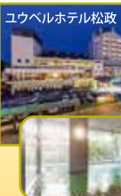
ユウベルホテル松政